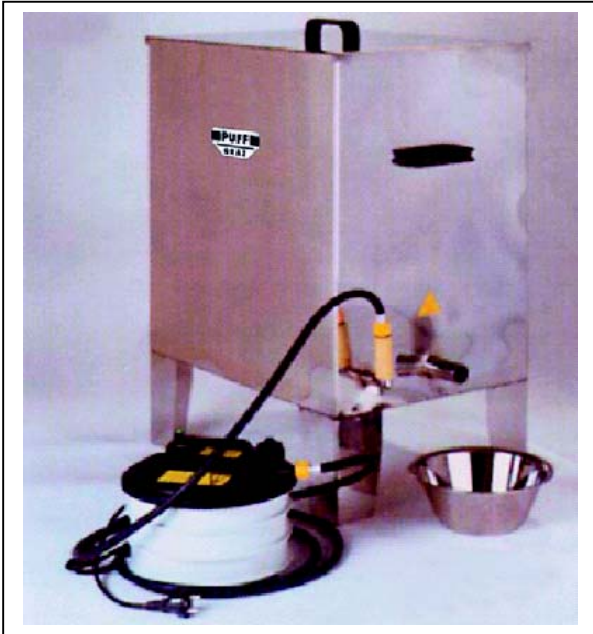
44030766 mit Dampfgenerator 2kW